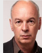
PHILIPPE VAN LEEUW